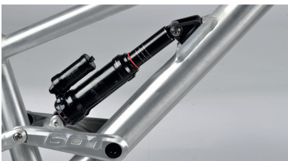
Abbildung 2: Einbaulage bei Kollision des Dämpfers

Bei einigen Rahmen des 601 Mk4 kann es vorkommen, dass die Bearbeitung zwischen den Verzahnungen am Dämpferschlitten für den neuen RockShox Super Deluxe Dämpfer fehlt. Bei gewissen Größen kann eine Kollision mit dem Zugstufenverstellrad auftreten. Baue in diesem Fall den Dämpfer wie unten im Bild zu sehen mit dem Ausgleichsbehälter nach hinten ein. (Abbildung 1)