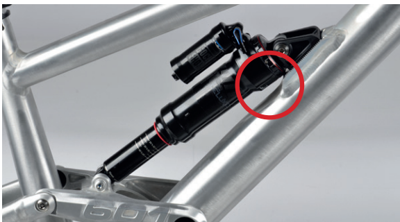
Abbildung 1: Standard Einbaulage

Bei einigen Rahmen des 601 Mk4 kann es vorkommen, dass die Bearbeitung zwischen den Verzahnungen am Dämpferschlitten für den neuen RockShox Super Deluxe Dämpfer fehlt. Bei gewissen Größen kann eine Kollision mit dem Zugstufenverstellrad auftreten. Baue in diesem Fall den Dämpfer wie unten im Bild zu sehen mit dem Ausgleichsbehälter nach hinten ein. (Abbildung 1)